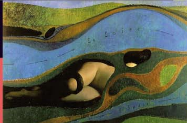
© Marc Ernst. Le jardin de France. 1992