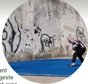
Raphaël Dupin